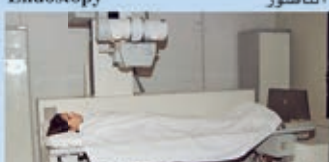
Radiology التصوير الشعاعي