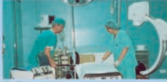
O. R. غرفة العمليات