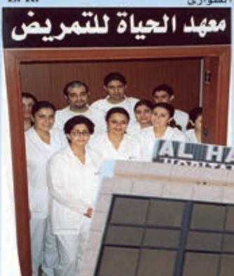
Al-Hayat Nursing Institution