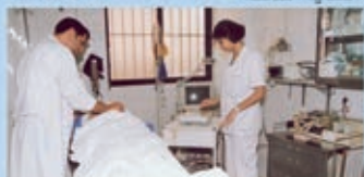
E. R. الطوارئ