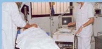
Lithotripsy تقنيات الحصى

130 BED GENERAL HOSPITAL, CARDIOVASCULAR FLAT PANEL INNOVA 2100 IQ, DIAGNOSTIC & INTERVENTIONAL, BALLOON & STENT, HIGH RESOLUTION, LOW DOSE RADIATION & MINIMAL CONTRAST MEDIA, I.C.N., I.C.U., C.C.U., DIALYSIS, SCANNER, MAMMOGRAPHY, ECHOGRAPHIES, ENDOSCOPIES, NURSING INSTITUTION, IVF & ICSI, LABORATORIES, ETC.