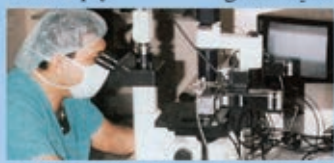
Fertility Center تقنيات الحمل الحديثة