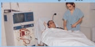
Dialysis غسل الكلى