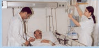
C. C. U. العناية الفائقة