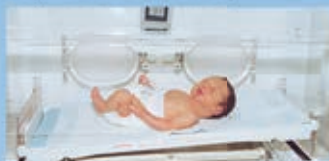
I. C. N. العناية الفائقة للمولودين الجدد