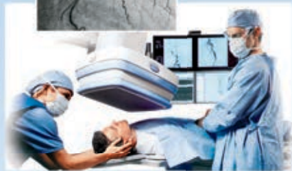
SHAYAH - LEBANON

TEL.: 01 546200 - 03 934567 - FAX: 01 277805